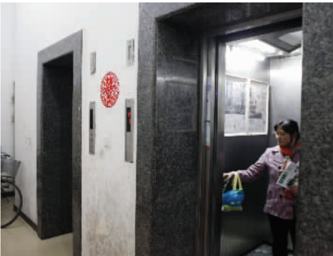
昨天记者赶到时，两部电梯仅一部在使用。而之前医务人员在现场时，两部电梯都处于罢工状态

昨天上午7点钟左右，市民张先生拨打现代快报热线96060报料称，江东北路世纪之星小区22楼有一名女子生病，救护车到了之后却发现单元楼里的电梯坏掉了。为了及时救治患者，有4名医护人员徒步爬上22楼。幸亏下楼的时候，电梯维修工赶了过来，使用手动操作模式，将他们送到了一楼。 现代快报见习记者 李宇龙