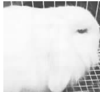
宠物也来凑热闹,曾经很瘦的兔子,现在变得很肥