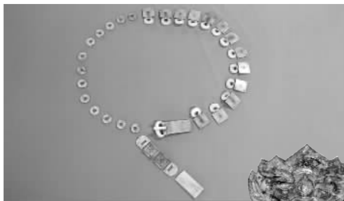
十三环蹀躞金玉带