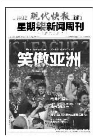
(上周星期柒新闻周刊封面)