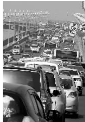
昨天上午大桥上车多缓行

快报讯（记者 张玉洁）昨天上午近10点钟，浦口的市民发现，通往长江大桥的浦珠北路上，车辆积压，已经堵了有两公里长，“大桥已经崩溃了。”市民王先生说，长江大桥由北往南过江的车道上，不知道发生了什么，堵得特别厉害。