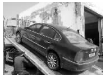
老赖的车被带回法院