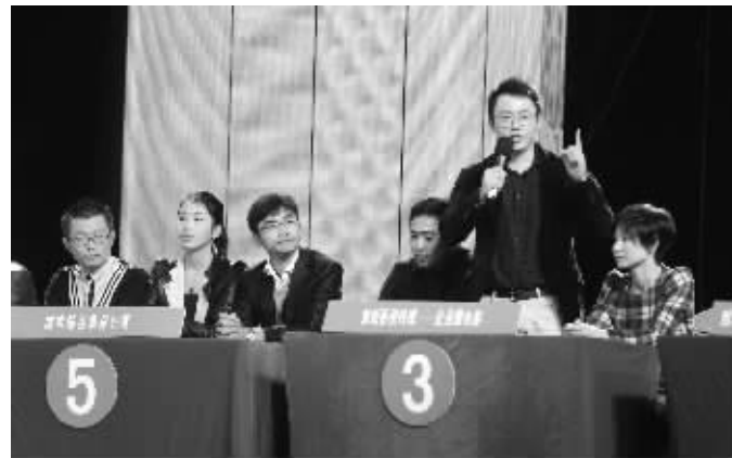
“赢在南京”南京大学生创业大赛昨天举行决赛

今天 晴到多云,西北风4级,5~15℃ 明天 晴,3~15℃ 后天 晴,2~14℃