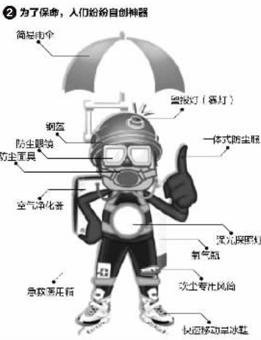
“@南京气象”发布的图解节选