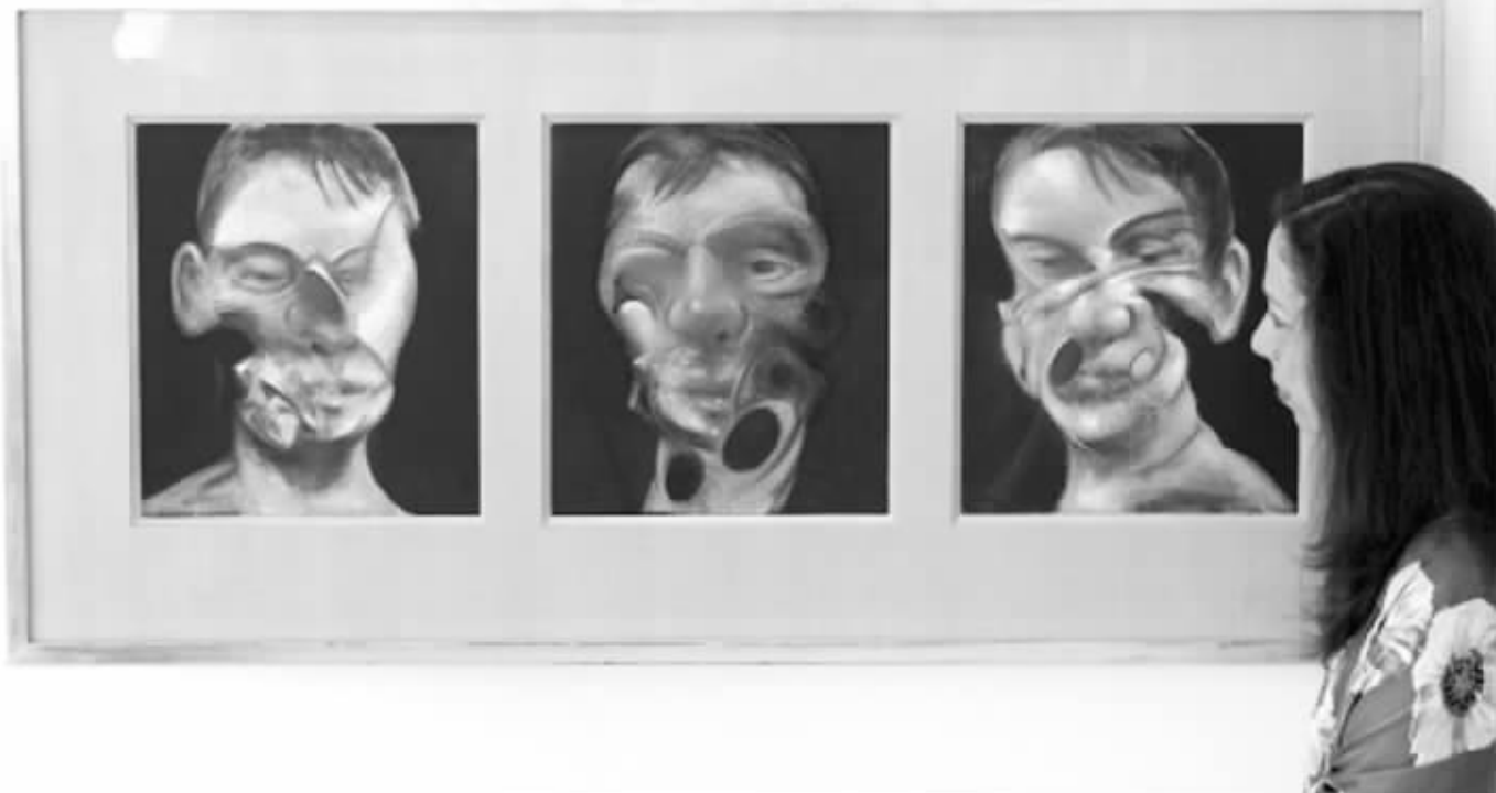
《一幅自画像的三件习作》