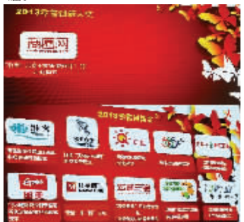
宏图三胞、商圈网喜获中国零售创新大奖