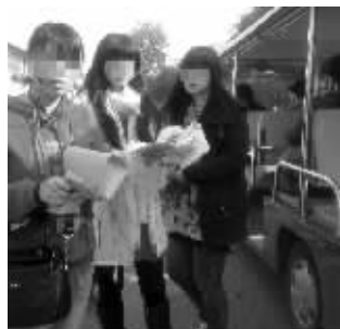
导游(左一)在游览车旁边收费