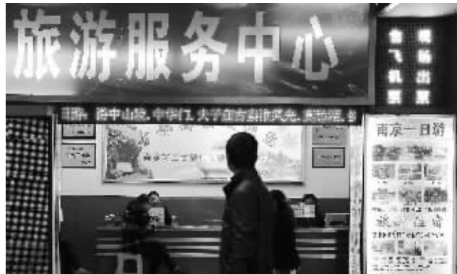
南京站出口处的一日游接待处,大屏上已经没有“每人50元”的字样