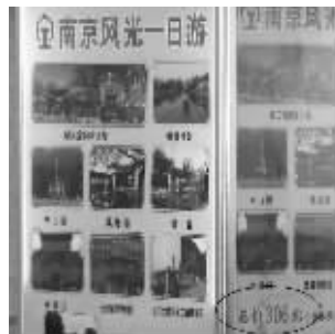
广告牌上标着“总价:306元”