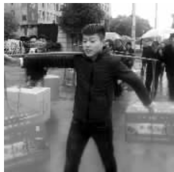
礼金、礼品以及参加送礼的人