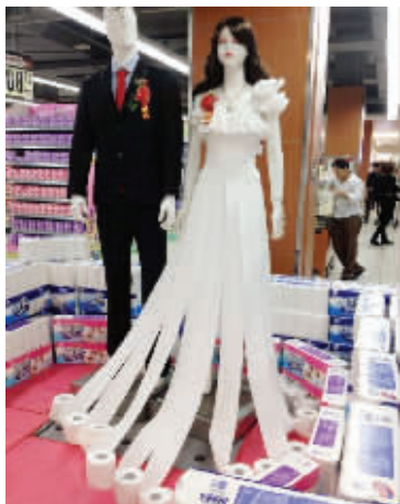
05 超市大妈则认为，在光棍节里，这样卖卷纸是个good idea。