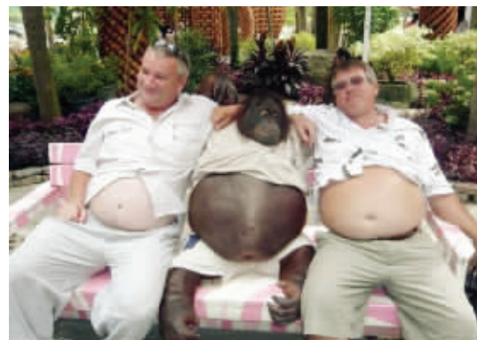
10 我们总在感慨，时间过得很快，喝啤酒的日子过去了。