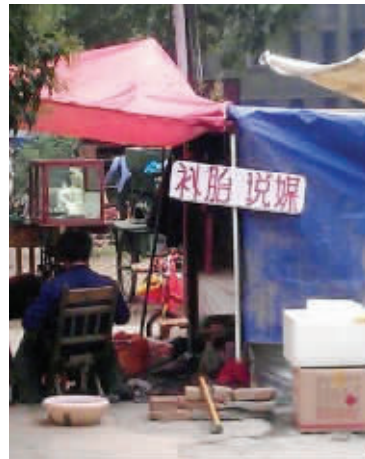
04 补胎的摊主也很有创意，他认为多种经营才能快速致富。