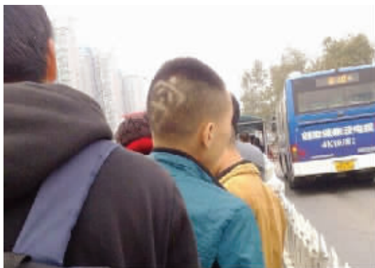
09 创意的背后，也充满了苦涩。这位哥们，真的是“削发明志”。