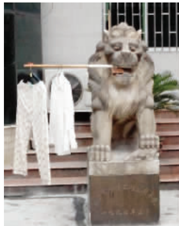
07 大门口石狮子，总是干着不属于它业务范围内的事情。