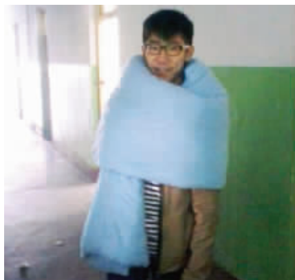
11 立冬了，天冷了，请大家给自己加一条围脖。