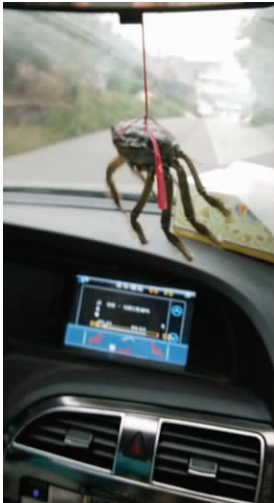
01 又到菊黄蟹肥时，我买了一只螃蟹，准备给自己做一顿大餐。