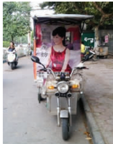
06 有的时候，创意是一种巧合。开车的是？第一眼你看错了吧？