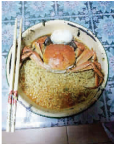
02 这就是我的大餐，你们没见过这么低调而又奢华的享受吧？