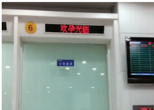
08 这位忙中出错的银行工作人员，大概是有着一种期望。