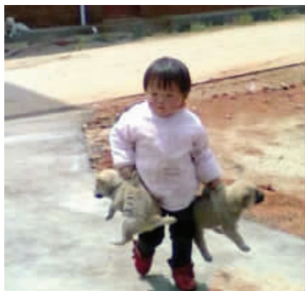
12 眼看年底就要到了，大家都要好好学习，不要再在外面疯玩。