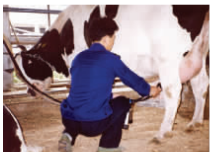
其他人眼中的卫岗