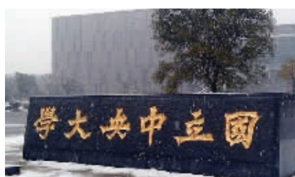
南京人眼中的南京大学