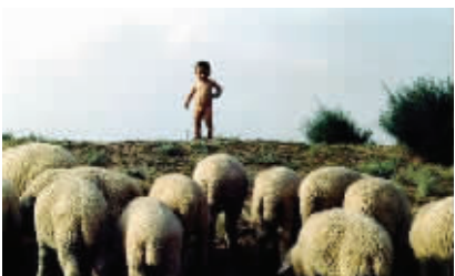
其他人眼中的仙林