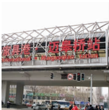
迈皋桥居民眼中的迈皋桥