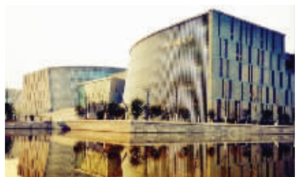
仙林居民眼中的仙林