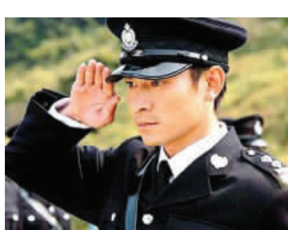
其他人眼中的警察蜀黍