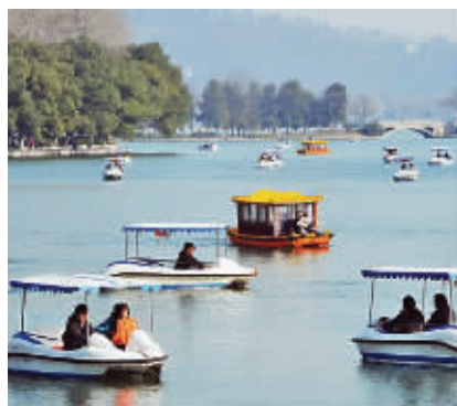
其他人眼中的玄武湖