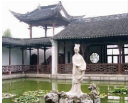
水西门居民眼中的水西门