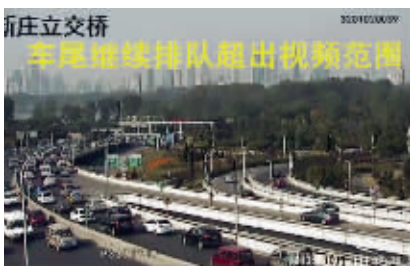
其他人眼中的新庄