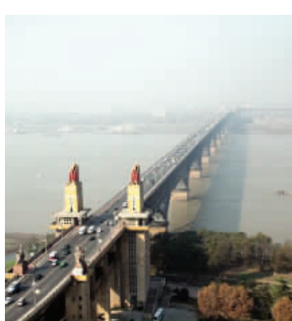
其他人眼中的长江大桥