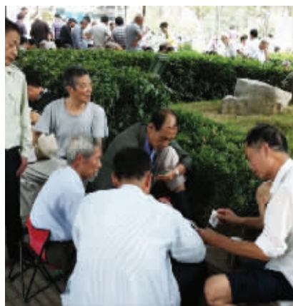
其他人眼中的迈皋桥