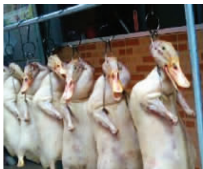
其他人眼中的水西门