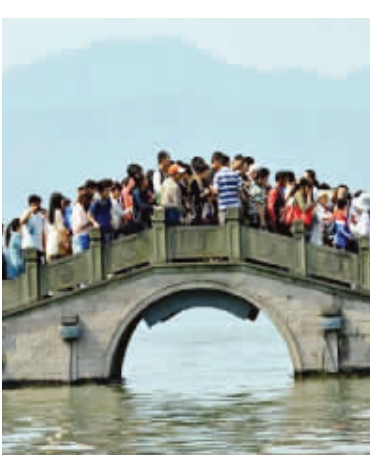
南京人眼中的长江大桥