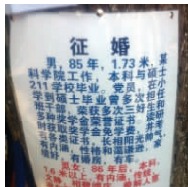
南京人眼中的玄武湖