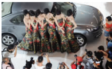
新庄居民眼中的新庄