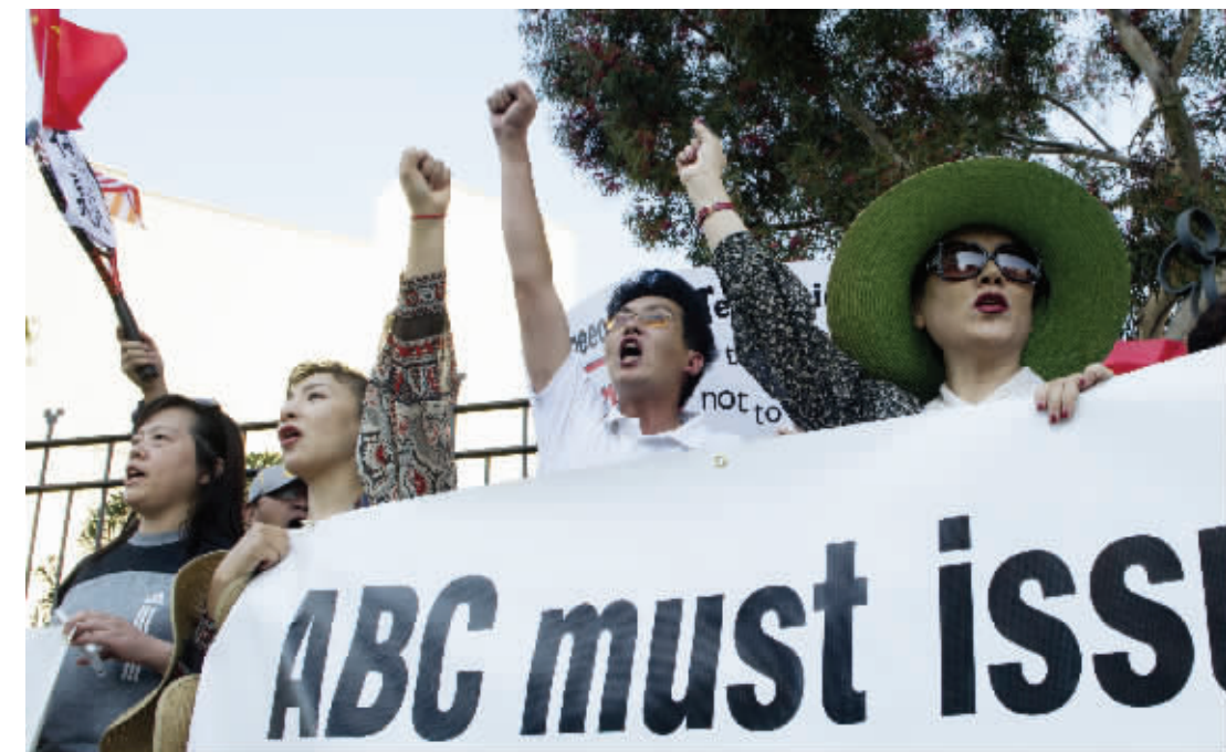
11月9日,在美国洛杉矶,华人华侨手持标语呼喊口号

声明说:“我们已经加强了节目审查制度,在节目播出准则以及娱乐节目内容方面采取了新的规范举措,以保证今后有类似问题内容出