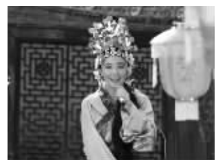
郭采洁的“丑女”扮相

青春喜剧爱情电影《意外的恋爱时光》昨起正式公映。影片自本周二启动26城联合点映活动后，观众口碑不错。而在影片的众多桥段中，最让观众们意外并且捧腹大笑的就是“女神”郭采洁扮丑成“杨梅仙子”段落。