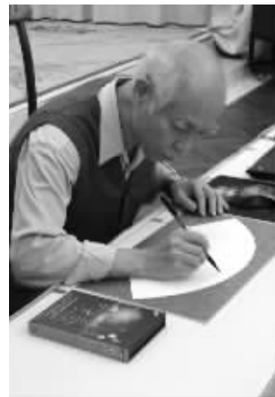
研究莎士比亚的泰斗级人物彭镜禧

据彭镜禧先生介绍，这出《约/束》曾应邀到英国莎士比亚协会、美国莎士比亚协会、美国各大学去演出，效果非常好。而从论坛现场播放的视频来看，演出过程中，确实是掌声、笑声不断。