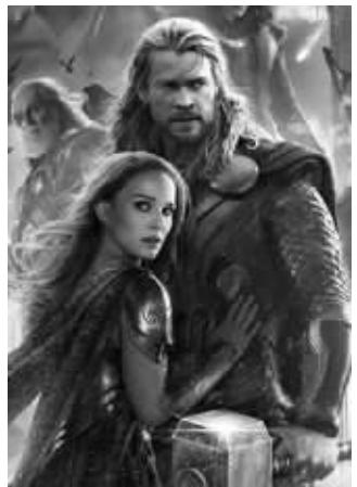
《雷神2：黑暗世界》海报

超级英雄大片《雷神2：黑暗世界》昨天起以3D IMAX、巨幕等多种版本在国内震撼上映。快报组织20名读者作为“快报审片员”免费在南京万达国际影城新街口店观看了这部电影。众“审片员”对此片评价颇高，大气磅礴的视觉效果