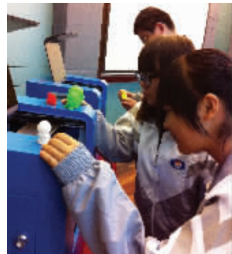
学生们在打印模型