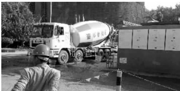
事发工地大门外,停着一辆和爆胎车辆相同型号的搅拌车