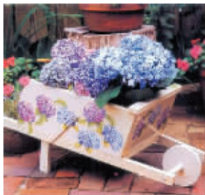
实木地板废料做成的花架

不少装修完的业主都有这样的经历,无论装修前多么精打细算,装修完工后多多少少都会剩余一些装修余料。这些余料留着占地,扔了可惜,如何处理这些余料让许多家庭感到头痛。今天,记者与你分享装修剩余材料的处理方法,让其变废为宝。