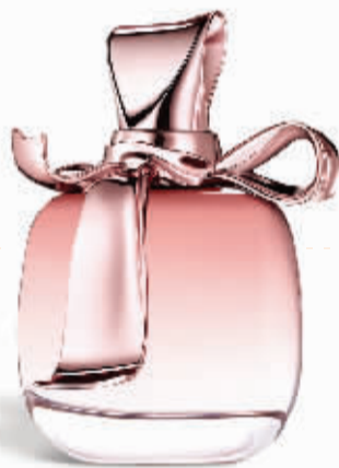
丽娜蕙姿 Mademoiselle Ricci 浓香水