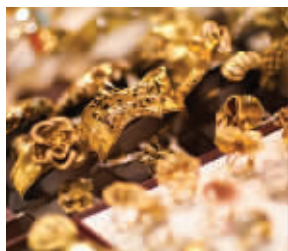
黄金饰品最低价格285元/克,时尚新款到货