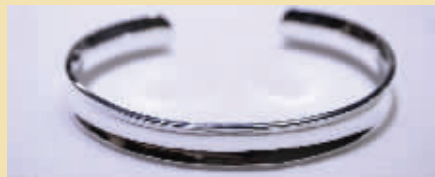
一款素雅的银镯市场价为598元,现场成交价仅为220元。(特价品,每天限购20个)