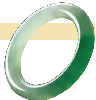
翡翠等玉石制品,价格约为商场价1-3折

玉石翡翠可成为本届珠宝节消费者重点关注的珠宝之一,因为价格实在太“亲民”。多位商家均推出翡翠、和田玉等高端大气上档次的玉石饰品。手镯、手链、挂件……上千万的玉石配饰让人眼花缭乱。翡翠中玻璃种、冰种、糯种、豆种、紫罗兰种等各个品级均有完美呈现,雕工细腻,玲珑剔透,光滑圆润。价格上最低仅需百元左右,而最高达到了数百万元。商场价格在万元左右,现场2000元左右即可收入袋中。而数万元的翡翠已经达到收藏级的级别。通过精心地挑选,快团要让每一个爱玉的人都能寻找适合自己的那一款。