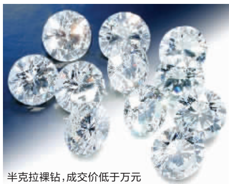
半克拉裸钻,成交价低于万元