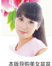
本版导购美女盆盆