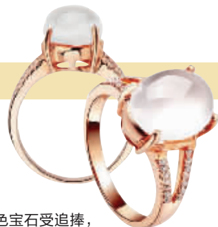
彩色宝石受追捧,成交价降至商场价5-6折

年终婚庆季中,钻石戒指必不可少。而南京女性对钻石的偏爱可以从商场的销售额中窥见一斑。但面对高物价低工资的当下,让女性消费者以更少的钱买到更好的钻饰成为快团网工作的重点。经过严密谨慎的挑选,在南京开设门店的知名品牌商与快团网合作,将会在珠宝节现场展示数百款裸钻以及数百款钻石饰品,现场裸钻从30分至2克拉均有展示销售。“30分以上裸钻均配有国际GIA证书,腰上有刻字,半克拉裸钻成交价可以低于万元。”该品牌商透露,钻饰现场售价要比商场售价便宜30%-50%。