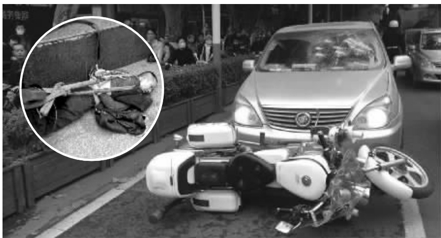
撞倒警摩后逃逸,肇事男子(图中圆圈处)被制服

昨天早上7点50分左右,一辆银灰色别克商务车在中山南路扭着“S”形向北行驶,沿途连闯多个红灯,驾驶员是名男子,交警将他拦下后,发现他精神恍惚,车上有管制刀具,试图将他制服。男子袭警反抗最终被制服。后经警方初步鉴定,该男子为毒驾。 见习记者 李宇龙 现代快报记者 张玉洁