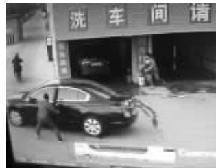
父亲试图控制住汽车 视频截图

“当时有四五个人在河里, 那个车底朝天翻着, 车门打不开玻璃也敲不碎, 后来把车翻正了把玻璃敲碎了才把人救了出来。” 当