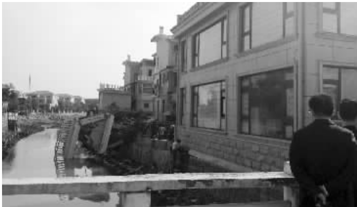
出问题的沿河别墅，其中一间房屋倒塌在河中