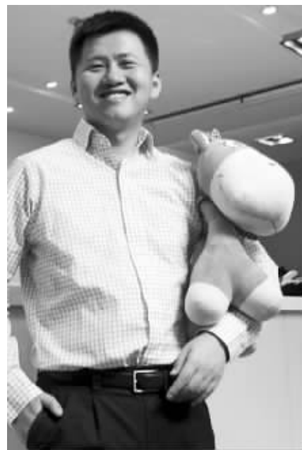
去哪儿网创始人兼CEO庄辰超 资料图片

庄辰超说:“未来去哪儿网会更关注长期盈利能力,近期内会关注在平衡的现金流情况下如何最大规模争取市场份额,上市后会采用更灵活的方式发展业务,不排除利用资本市场的力量进行有选择的战略收购和战略联盟。”