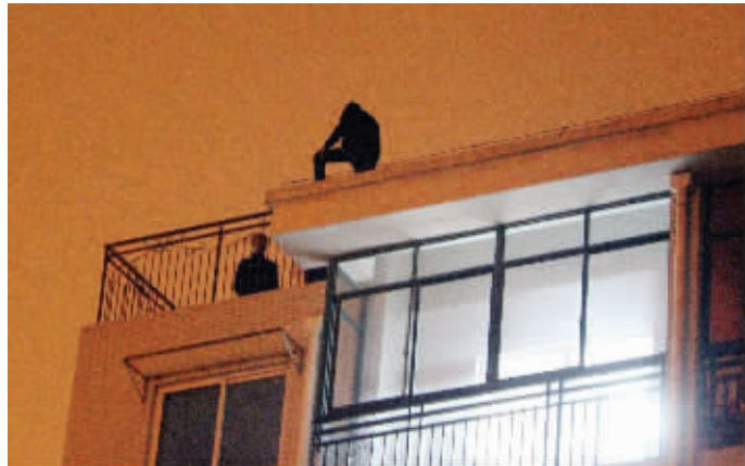
民警在楼顶劝说小偷

昨天零点,在南京江宁竹山路武夷绿洲小区,大部分居民都已经熄灯入睡,可是在小区10幢的楼顶还在上演一场艰苦的拉锯战:楼下是大批的民警、保安以及物业人员,六楼顶部边缘则是一个年轻的男子,准备要跳楼。原来他是准备入室行窃被居民发现,在被困的情况下才爬到楼顶,并声称要跳楼。