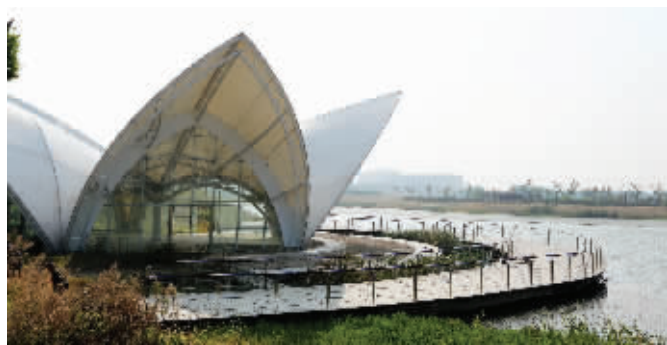
海安县被指山寨版的“悉尼歌剧院”

海安建“山寨版”悉尼歌剧院的帖子一出,引发众多网友关注。有网络媒体昨天报道称:“据当地百姓讲,这座建筑建设完成已经有几年时间了,但一直没投入使用,外围被菜地和杂草包围,里面除了被当地农民堆放了几个豆秆外,空空如也。”