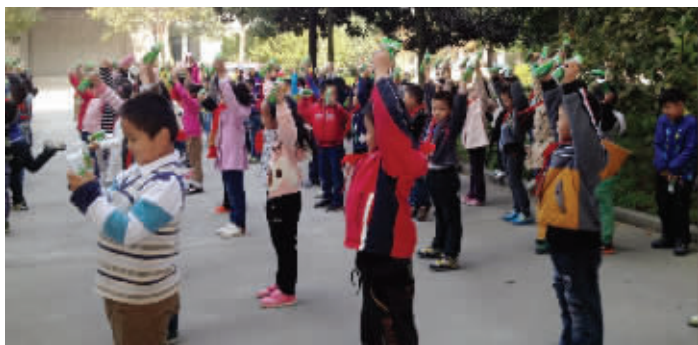
昨天,盐城市实验小学学生在用这种酸奶瓶做操

知,学生需要其瓶子做操。“超市积极联系供应商供货,但还是供不应求,已经销售了近千瓶,销量是平时的几十倍。”