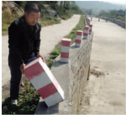
现场有的石墩已经松动

据了解,该泄洪沟由水库管理方承包给一家养护公司负责日常管理,陡坡上的石墩属于警示标志,用于提醒众人不要靠近,以防跌落