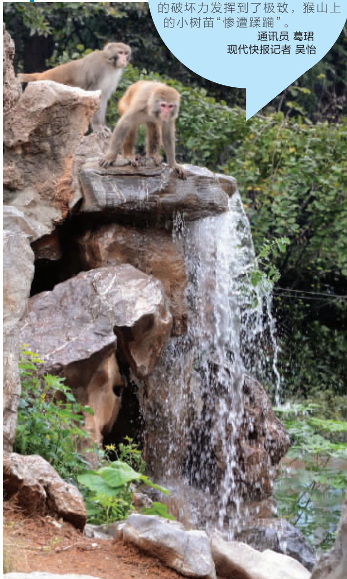
改造后的猴山增设了“水帘洞”