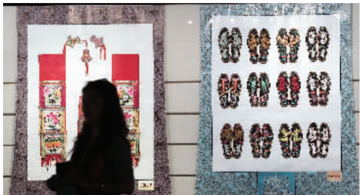
青海民间艺术品

展厅内的皮影也很吸引人,其中以唐僧取经一组最特别。孙悟空走在最前面,唐僧骑在马上,跟在后面。猪八戒排在第三,他并不是电视剧里演的那样,有一个大大的肚子,而是个瘦高个,顶着一个猪脑袋;一只手牵着沙和尚。给人的第一感觉就是“太萌了。”