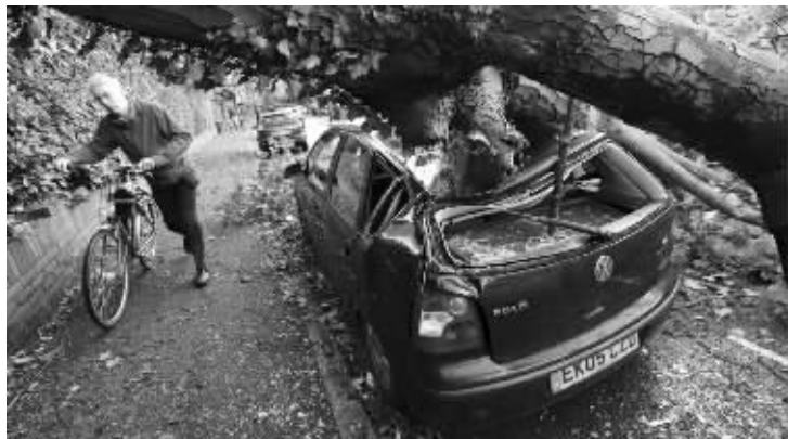
大树被拔起,砸毁汽车

1979年11月4日,激进的伊朗学生占领美国驻伊朗使馆,扣留数十名美国人质达444天。1980年,美国宣布与伊朗断交。此后,美伊关系长期处于紧张状态。据新华社