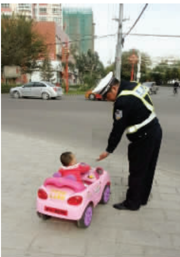
05 这位警察叔叔也很机智,一大早就抓获了一名交通违法的驾驶人。