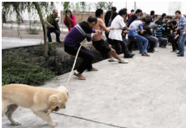
13 卖萌的背后,也要付出汗水。