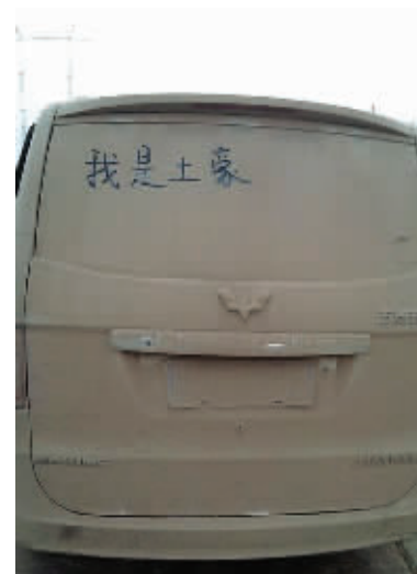
06 不过,这位车主,未免也机智得过了头,你不洗车也就算了,还给自己弄个土豪的头衔。