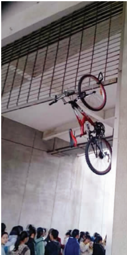
01 机智的我,终于找到地方锁车了!但是,门卫大叔却不为我的机智所动。