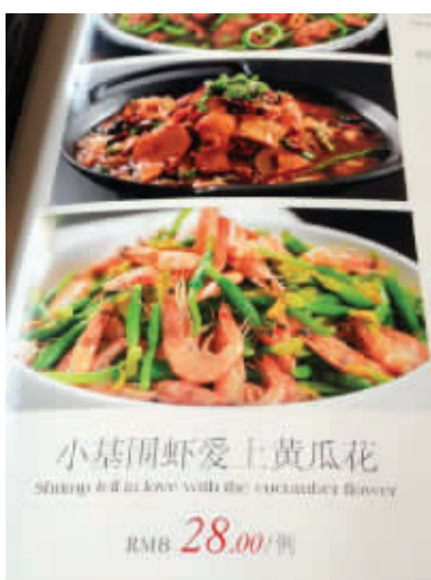
09 有的时候,机智过了头就是卖萌。一个菜名起成这样真的好吗?