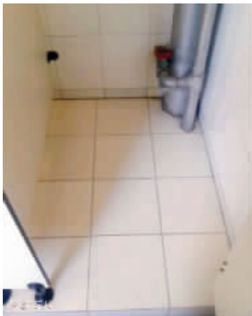
02 机智的我,终于在肚子疼时找到了厕所,但是,设计者比我更加机智。