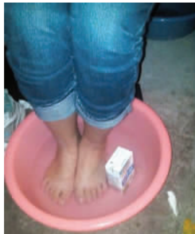
04 我的室友也很机智,他找到了不浪费热水但是又能热牛奶的好办法。