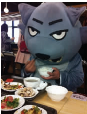
12 大家要看到,机智的背后也要付出艰辛。