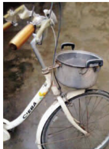
07 机智有的时候是自发的,比如这位哥们,DIY的创意让人刮目相看。