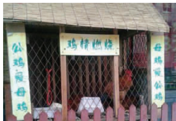
11 一个饭店给鸡舍挂这样的对联,考虑过鸡的感受么?