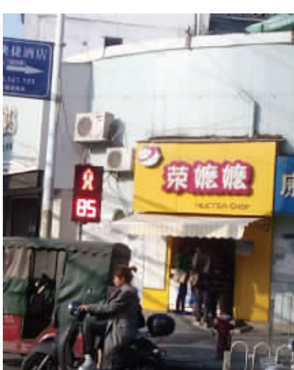
10 一个奶茶店起这样的名字真的可以招揽很多生意么?