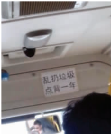
03 我很机智,但是,我发现世界上有更多人机智的人。比如这位公交车司机。