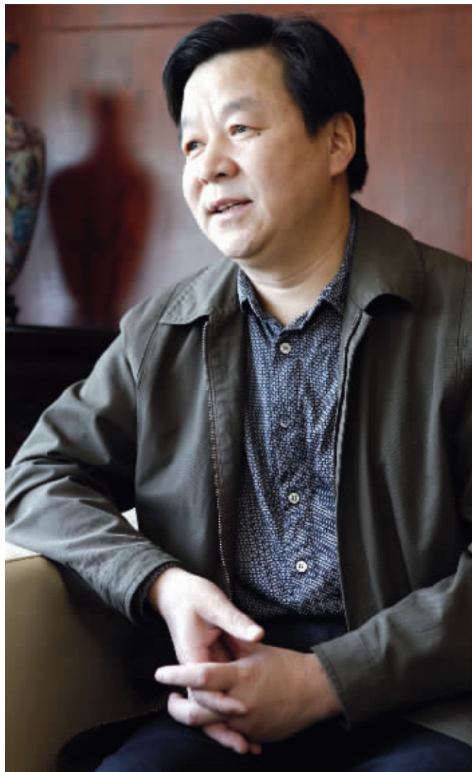
江苏省文化厅副厅长、南京博物院院长龚良

龚良: 不多。国家博物馆特别大,展出文物数量也很庞大。但在省级博物馆中,一下展出4万多件文物,可能没有。