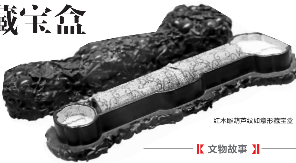
红木雕葫芦纹如意形藏宝盒