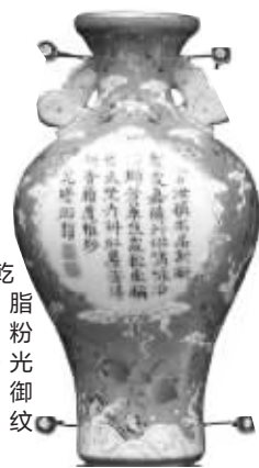
乾隆胭脂红雕粉彩开光墨彩御题诗纹轿瓶

在特展馆盛世华彩展厅,有一组乾隆时期的瓷器瓶子非常有趣,这些瓶子是可以悬挂的,而且是乾隆坐轿子时挂在轿子内壁上的轿瓶。据布置该展厅的霍华介绍,乾隆皇帝一生六下江南,四次东巡,每年还要到木兰围场打猎。迢迢万里,轿子是他重要的出行工具。而乾隆每次出行,轿子里都喜欢挂上这样的瓶子,并且还为此心爱玩意写过七首诗,其中有件胭脂红雕粉彩开光墨彩御题诗纹轿瓶上就写着这样一首诗:官汝称名品,新瓶制更嘉。随行供啸咏,沿路撷芳华。挂处轻车称,簪来野卉斜。红尘安得在,香辇度维纱。后跋“乾隆御题”。这首诗作于乾隆八年(1743),这时乾隆皇帝33岁,第一次东巡并演练部队,这首诗