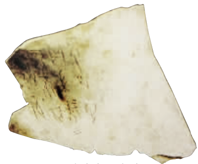
甲骨文 妇好冥卜辞