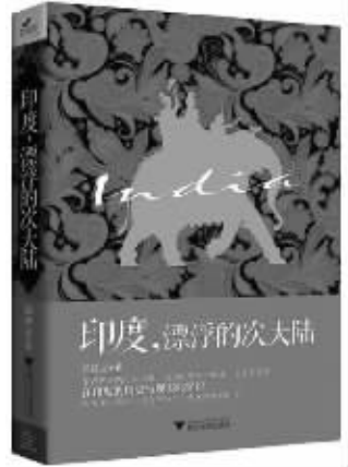
《印度,漂浮的次大陆》 郭建龙著 浙江大学出版社 2013年8月