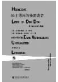
《民主德国的秘密读者》 [德]齐格弗里德·洛卡蒂斯 社会科学文献出版社 2013年10月