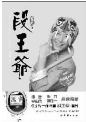
戴军 著 团结出版社友情提供