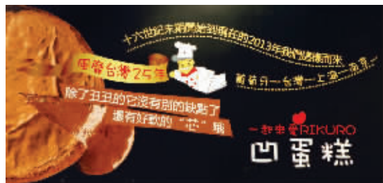
“瑞可爷爷”蛋糕店的宣传网页