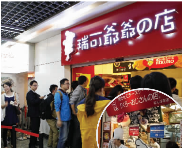
上图:南京地铁站内的“瑞可爷爷”店门前,排队者很多