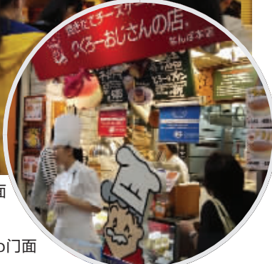
右图:日本的蛋糕品牌Rikuro门面