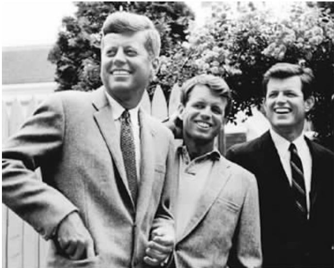
肯尼迪三兄弟，约翰·罗伯特(中)、爱德华(右)

据英国《每日邮报》10月20日报道，一本新书宣称，美国前总统约翰·肯尼迪死后，其大脑可能被其弟弟罗伯特·肯尼迪偷走，以隐瞒其死前病情和服用的药物。