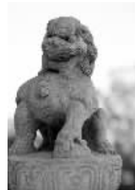
你肯定是练健美的