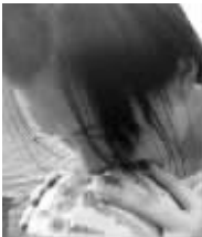
女汉子有一口好牙

小闺蜜小名媛午后聚集。她们会讨论这块小甜饼的卡路里含量,蓝莓酱是否是从北美空运的,茶叶是否产自斯里兰卡……其间还会怀念起在伦敦留学时喝过的英式红茶才最正宗,北京阴霾的天气已经有了几分伦敦的影子,不禁让人感慨万分。