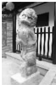
这货是个神马玩意