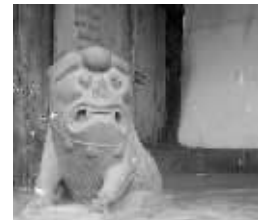
迎面而来的土豪的乡气