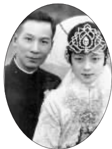
刘纪文结婚照

作为民国时期的首任南京市长,刘纪文亲自规划设计南京的城市交通,被誉为“铁腕市长”。昨天,在中山陵的中山书院举办刘纪文生平展。他的次子刘良栋将珍藏已久的《总理奉安纪念册》和《南京市市区一万分一图图表》捐赠出来,包括158张照片和57张文物史料。