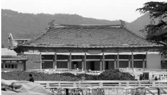
抬升加固后的南博老大殿

南京博物院的前身是民国时的“中央博物院”,今年整整80岁了。当年它倾注了徐敬直、梁思成等一大批建筑大师的心血。然