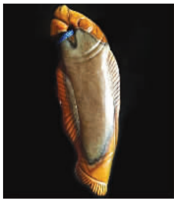
罕见的和田玉籽料雕件