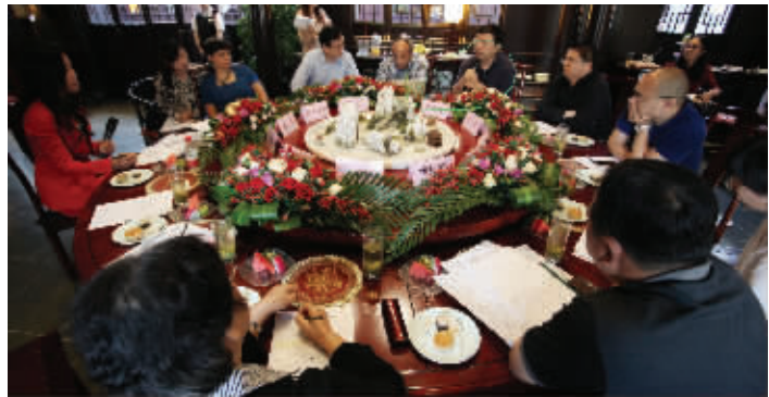
雅居乐·长乐渡会馆高端峰会高朋满座