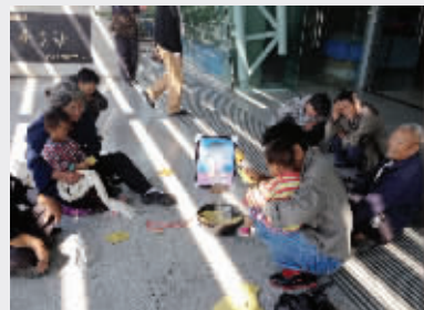
亲人的离去让家属悲痛不已

卫生间窗户分为两部分,上半截是通风窗,大约有30厘米宽,40厘米长,很容易拉开,但只能打开到45°位置,她是怎么出去的