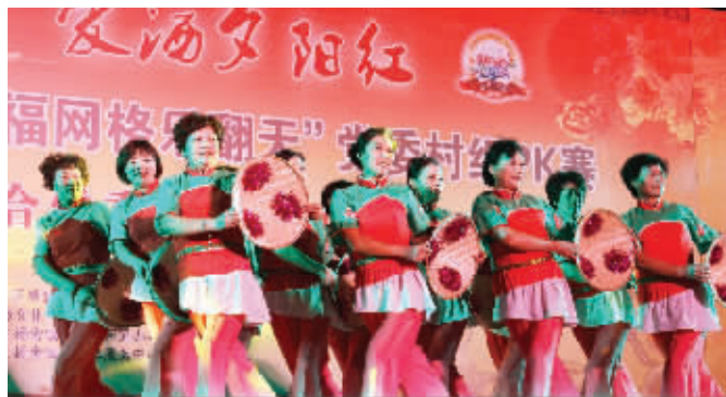
张家港“幸福网格乐翻天”之“爱洒夕阳红”专场

10月11日晚,张家港经济开发区2013年“幸福网格乐翻天”之“爱洒夕阳红”专场PK赛在万红苑小区广场上举行。比赛现场气氛紧张激烈,参赛的中老年群众用舞蹈、古筝、独唱、重唱,甚至模特走秀等形式在舞台上决一胜负,向所有社区民众展现了他们迷人的风采。