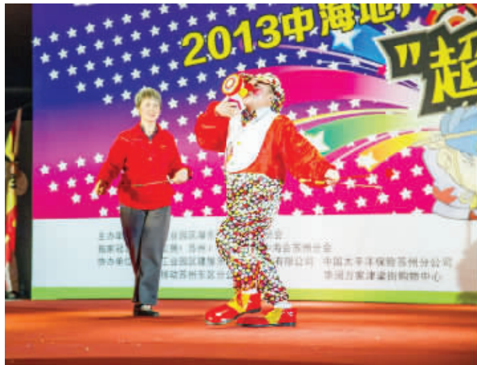
老人们的精彩表演让年轻人叹服

据了解,“幸福网格乐翻天”才艺PK赛是张家港经开区的一项群众性文化活动,有初赛、复赛、月赛以及年终总决赛的形式,举办一年多以来吸引了40个文化团队、超过3000名居民演员参加比赛,居民们常说这是大家家门口的“星光大道”,平日里只做做家务的普通居民也能实现自己的梦想,也涌现出了不少草根明星。 王玲玲