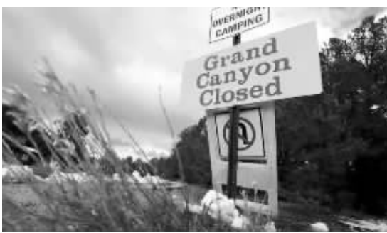
大峡谷国家公园的关闭告示牌