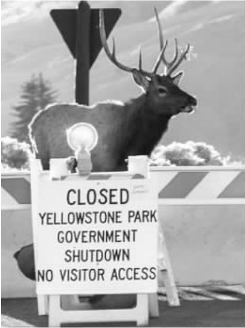
黄石公园的关闭告示

秋季是基奈河捕捞的季节,通常每年10月底就会关闭,所以即使美国政府重新开张,人们也不会再来这里了。