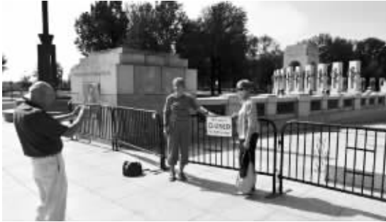
华盛顿二战纪念碑也关闭了