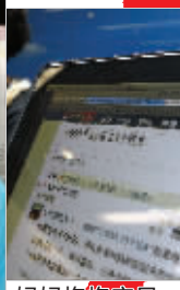
妈妈抱宝贝 爱心群

2012年10月26日起,现代快报与中央电视台联合,启动了“感动中国2012年度人物”江苏推选活动。