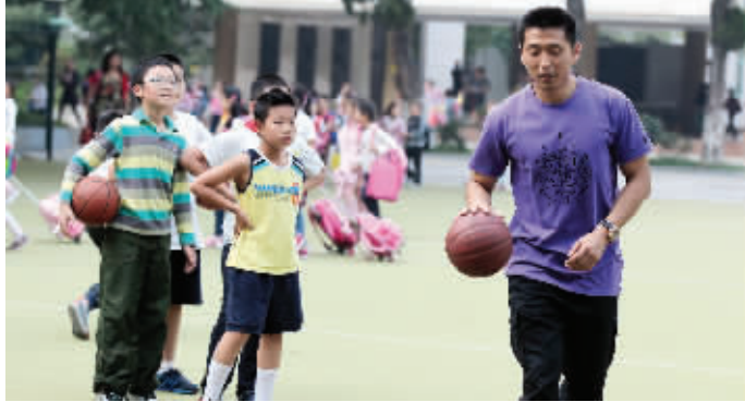
胡雪峰在教小朋友打篮球