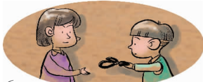
6 递剪子时要手攥剪子尖儿,把剪刀柄让给对方。 漫画 俞晓翔