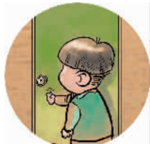
4 串门敲门时先敲一下,再连敲两下,急促拍门属于报丧。