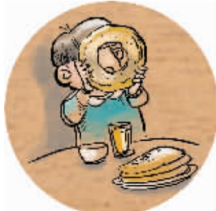
3 吃烙饼不许从中间吃,咬一洞像纸钱,老人不高兴。