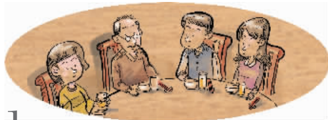
1 长辈坐正中,其他人依次而坐,夫妻要挨着。