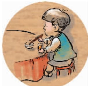
5 不许用筷子敲盘碗,有乞丐之嫌,在外这叫骂厨子。