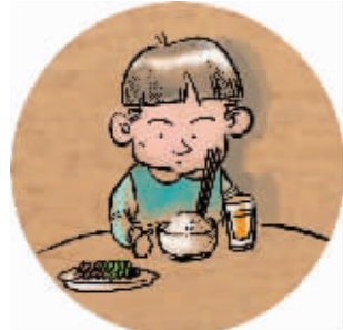
2 筷子不许立插米饭中,因为象征着香炉。