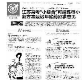
现代快报相关报道

自今年8月起,有关江苏高考方案改革的传言此起彼伏、版本众多。近日,又有声音称“本届高一一开始‘小高考’加分拟取消”“江苏新高考方案拟考语数+‘小综合’”“3+‘小综合’可能性最大”。昨天,江苏省教育厅发布通告称,“一旦江苏高考方案形成,江苏省教育厅将及时通过新闻发布会等形式向社会公布。” 现代快报记者 金凤