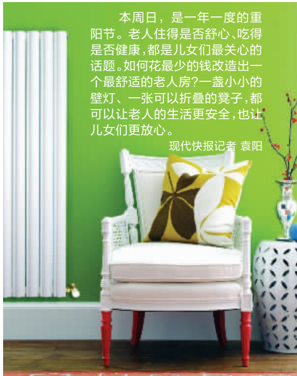
已装修的老人房,可以选择明管供暖