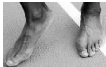
残酷的训练让博尔特的脚变形很严重

伊布曾在接受媒体采访时,讲述了他适合踢球的生理特征,透露他的大脚对踢球有好处:“你们看,我现在个子大,手脚大,也不是从小就有的,比如我的身高,在一个夏天之内猛长。那时我16岁,度假归来我高了13厘米,旁边的人都不认识我了,我突然变成了学校里最高的人。显然,手脚长得也快。那时钱不多,没条件经常换鞋,我就被迫用一双鞋踢下去,鞋紧得要命非常难受。”“成年后,我经常练习跆拳道,两条腿用得更多,摆金鸡独立的姿势也多,所以两脚的大脚趾变得很有力很敏感,也比平常人的大。我如今在足球场上的很多动作,你们看起来比平常人要轻松,来源于我从跆拳道中的学习,我只需轻微的足部摆动,就能达到要求。”