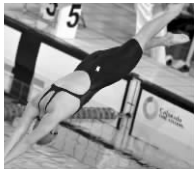
大脚是叶诗文夺冠的关键“武器”

叶诗文坦言,这双42码的大脚是自己夺冠的一个重要“秘笈”。她说:“大脚对我帮助很多,感觉在水里就像穿了一双脚蹼,打水时游起来很给力。”在水中,脚掌大小对打水有着重要作用,在混合泳的四种泳姿中,蛙泳和蝶泳与脚掌大小关系相对较小,而在仰泳和自由泳中作用就很关键了。叶诗文在伦敦奥运混合泳项目中的表现,最强的是自由泳,其次是仰泳,而蛙泳和蝶泳较弱,这正好印