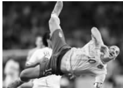
伊布在场上总能踢出令人匪夷所思的球

足球场上,除了梅西、C罗,伊布是又一个公认的天才,那么高的个子却脚法出众,经常能给对手致命一击,这一切似乎与他的大脚有关联,他的脚也有46码,在足球运动员当中算大的。